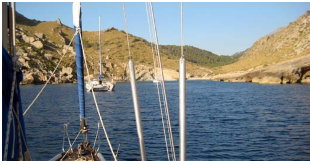
Cala Figuera, by Cabo Formentor

Un buon esempio di come si possa sviluppare il turismo senza martoriare eccessivamente il paesaggio, le Baleari sono immensamente popolari tra i turisti del nord Europa, che apprezzano i collegamenti efficienti, gli ottimi marina e una organizzazione turistica che purtroppo l'Italia si puo' soltanto sognare. Ogni isola è profondamente diversa, una metà in se stessa, ma tutte offrono ottimi servizi nautici, baie riparate e organizzate flotte di charter. La costa este di Maiorca e Minorca offrono i paesaggi piu' spettacolari, vento frequente, baie riparatissime, favolose cittadine storiche e paesaggi quasi scozzesi... E' l'itinerario piu' avventuroso e meno mondano. La costa ovest di Maiorca, abbinata a Ibiza e Formentera, è invece piu' tranquilla come vento, offre spiagge caraibiche e una vita mondana senza rivali. La lingua ufficiale di Formentera è l'Italiano.