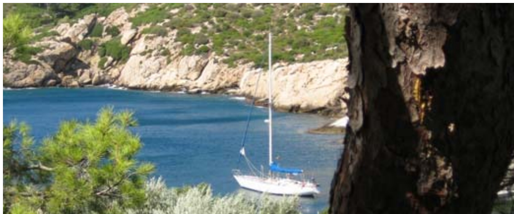
Ancoraggio di Dragonera

Storia e Arte: Palma è una città molto piacevole. Val la pena lasciare qualche giorno per gite a terra, specie verso la costa nord e i villaggi di Deià e Valldemossa. Le attrazioni di Ibiza e Formentera sono invece leggermente meno artistiche.