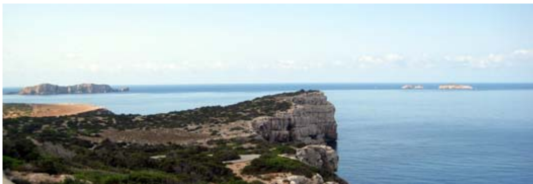
Islas Bledas da Conejera

La Costa N di Ibiza offre una nuova prospettiva di questa isola varia e altrimenti modaiola. Scogliere selvagge a picco sul mare. Alcune baie, di cui un paio ben protette e profonde, intagliano la costa. Segnaliamo Cala Binirras ( 39° 5'22.87"N, 1°27'5.98"E ), a circa metà isola, una baia abbastanza ampia protetta da quasi tutti i venti eccetto il NW, e Cala Portinax, una baia ideale per preparare la traversata verso Maiorca (o riposarsi all'arrivo da). La costa non offre ripari dal forte maestrale.